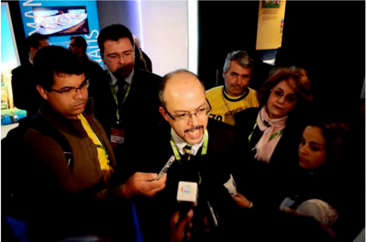
(Luiz Baretto Minister of Tourism at the press conference)

The exhibition forms part of World Football House, a ground-breaking exhibition that provides each of the 32 countries participating in the World Cup with a dynamic platform to showcase their national brand identity and to celebrate their respective cultural and commercial assets.